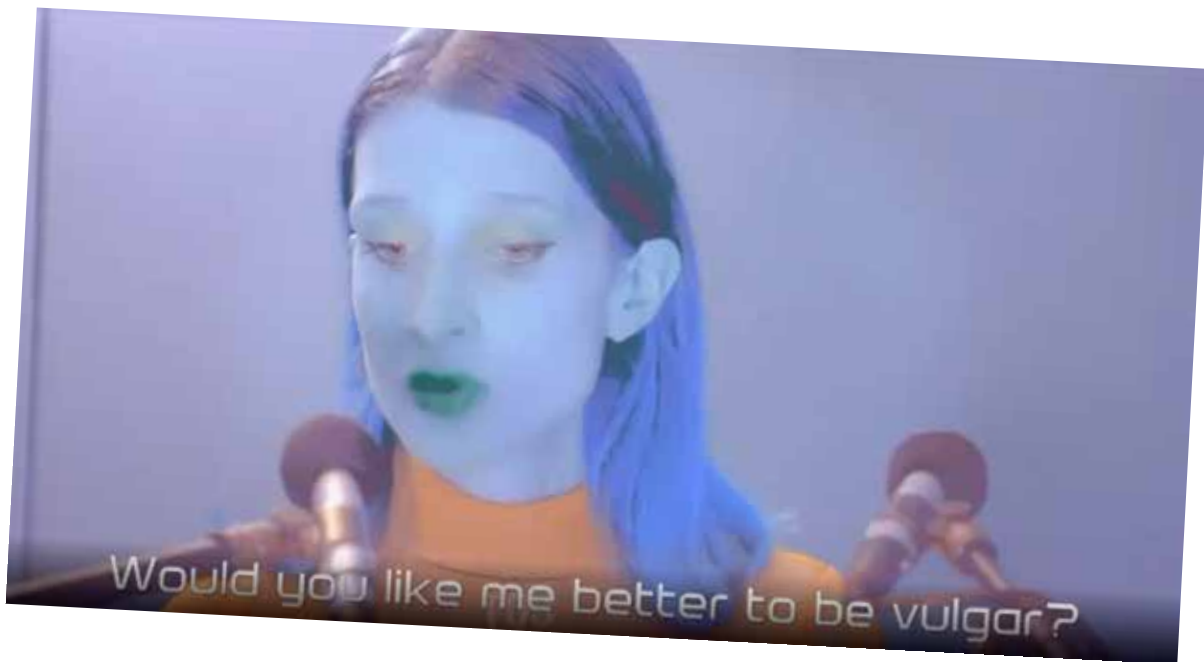
2020, Asmr-sick of love