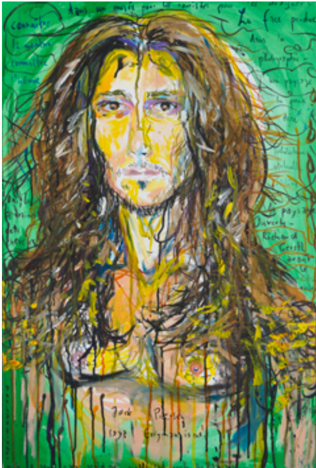
Le paysage ouvert, 2009 acrylic on canvas, 60 x 90 cm

2003 „Nackt und mobil“, CEM - Museum für Aktuelle Kunst, Den Haag, Sammlung Essl, Klosterneuburg "Communifrontationsilence". Galerie Akinci, Amsterdam 2002 "Silent scream", Kenny Schachter "contemporary", New York "He can't make babies, so he eats them", Emily Tsingou Gallery, London 2001 "I Am Your Man", Ars Futura, Zurich "In the Arms of Luck", Galerie Drantmann, Brussels 2000 Gallery Side 2, Tokyo "Nobody has to know", Portikus, Fran-