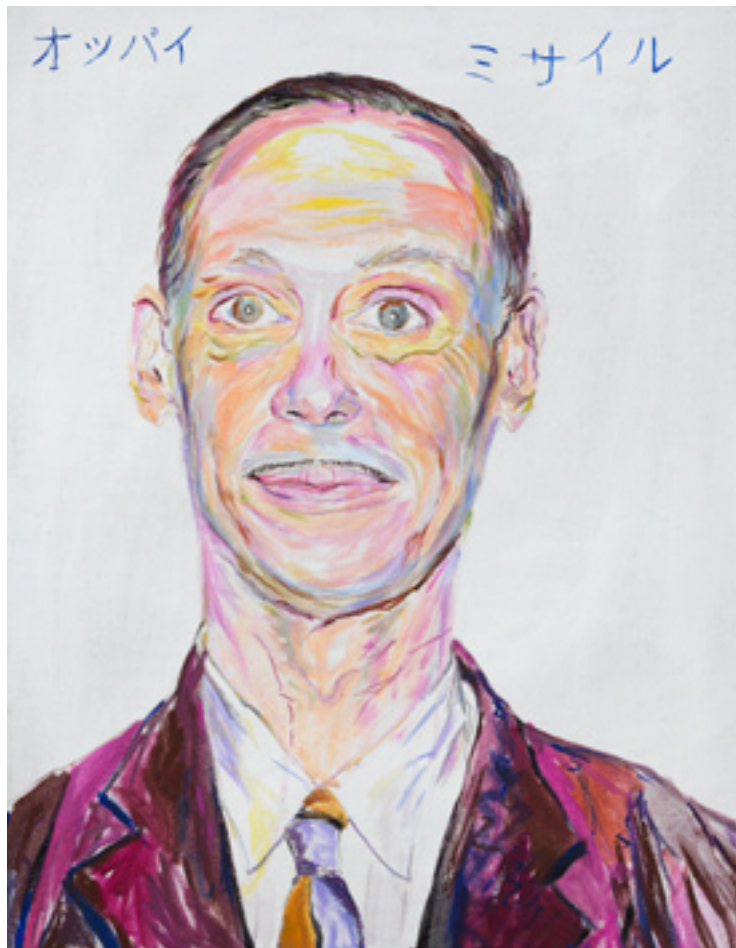
John Waters and Tittenrakete, 2004 acrylic on canvas, 70 x 55 cm, Courtesy Elke Silvia Krystufek / Galerie Meyer Kainer

"My Generation", The Atlantis Gallery, London „Reisen ins Ich - Künstler/selbst/Bild“, Sammlung Essl, Klosterneuburg 2000 „Lebt und arbeitet in Wien“, Kunsthalle Wien, Vienna "Protest & Survive", Whitechapel Art Gallery, London "Don't let it in, don't let it out", Knoll Galéria Budapest "Presumed Innocent, Childhood and Contemporary Art", capcMusée, Musée d'art contemporain de Bordeaux 1999 "A Girl Like You", Galerie Praz-Delavallade, Paris "FunktionsSystemMensch", Museum Bochum