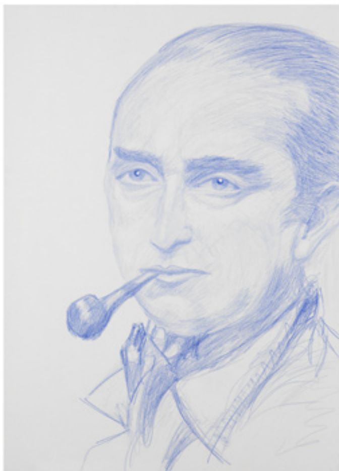
Max Pechstein, 2009 acrylic on canvas, 70 x 50 cm.

terreich 1970-2010“, RLB Kunstbrücke Innsbruck „Lange nicht gesehen“, Haus der Kunst, Brünn „Collection of Prints and Drawings-Photographs“, statens museum for kunst, kopenhagen “FRACTIONAL SYSTEMS: GARAGE PROJECT II”, MAK Center, Los Angeles “Bodies and Fractured Spaces“, Austrian Cultural Forum New York “Eating the Universe“, Taxispalais, Gale- rie des Landes Tirol “Alles anders?“, Lecture Performance gemeinsam mit Hassan Baroud, Wiener Fes- twochen' “Hareng Saur - Ensor and Contemporary Art“, S.M.A.K., Gent