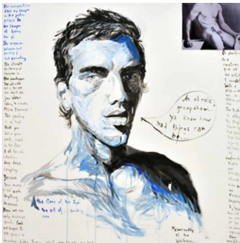
No composition, 2009. acrylic on canvas, 100 x 100 cm.