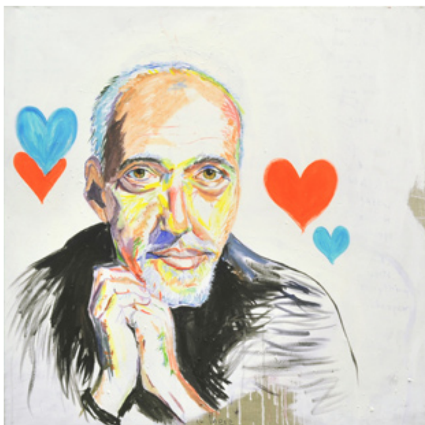
Paulo Coelho, 2004 acrylic on canvas, 100 x 100 cm. Courtesy Elke Silvia Krstufek / Galerie Meyer Kainer

„Österreichische Kunst am oberen Tassenrand“, ikob Museum für zeitgenössische Kunst, Eupen, Belgium „simultan“. Zwei Sammlungen österreichischer Fotografie aus den Beständen des Bundes und des Museum der Moderne Salzburg, Fotomuseum Winterthur „Para todos los públicos“, Sala Rekalde, Bilbao „Österreichische Kunst von 1900 - 2000. Konfrontationen - Kontinuitäten“, Sammlung Essl, Klosterneuburg „Face to Face“, Ausstellungshalle zeitgenössische Kunst Münster „SURreal. Aspekte des Figuralen aus der Sammlung“, Museum der Moderne Salzburg 2005 „Nach Rokytník“, die Sammlung der EVN,