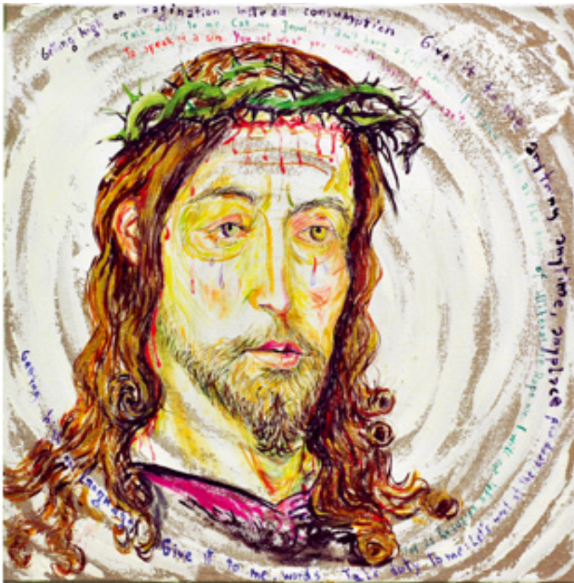
Give it to me, words, 2004 acrylic on canvas, 60 x 60 cm, Courtesy Elke Silvia Krystufek / Galerie Meyer Kainer

„Dark continents“, MOCA, North Miami „EGO Documents“, Kunstmuseum Bern, Bern „System Mensch. Werke aus der Sammlung des MdM Salzburg“, Museum der Moderne, Salzburg „Summer Show“, Royal Academy, London „Nouvelle Collections III“ (Sammlung Jocelyne & Fabrice Petignat), Centre PasquArt, Biel „SchauM“, Kunstverein Mannheim (curated by Jessica Beebone and Andrea Domesle) Prague Triennale (curated by Pilvi Kalhama), Prague „Sexism?“, (curated by Pavel Humhal), Galerie Václava Špály, Prague MATRIX, MUSA, Museum auf Abruf, Vienna 2007 „Hard Rock Walzer - Contemporary Austrian